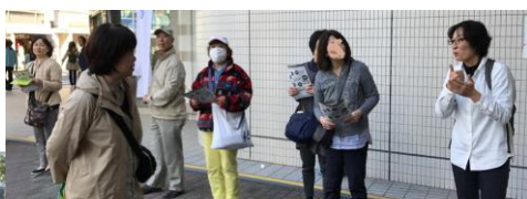
手話による訴えを読取通訳